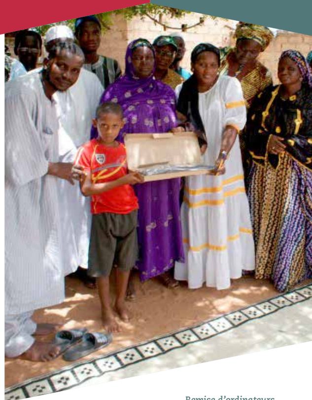
Remise d'ordinateurs Daara Aboubakry Sow de Louga